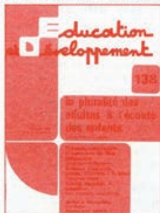
Education et Développement, n.º 138, enero 1980. 11, Rue de Clichy, París 9.

Lo único que la circular no señala es un gran problema: ¿hasta qué punto los actuales profesores están preparados para asumir estas actividades? ¿Hasta qué punto un profesor tradicional es capaz de convertirse en animador de grupo?