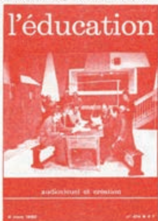
La revista L'Éducation es semanal: su precio anual es de 120 FF. Se edita en Francia. 215 Boulevard Macdonald 75008, París

tion dedicado a los medios audiovisuales y la creatividad.