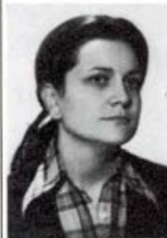
Angeles Arraiz E.G.B. II