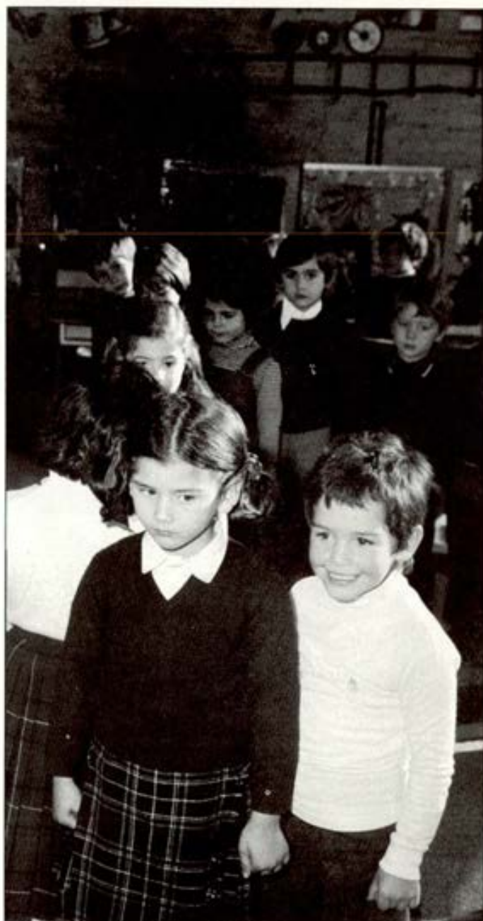
Soy toda la necesidad de amor y cariño.