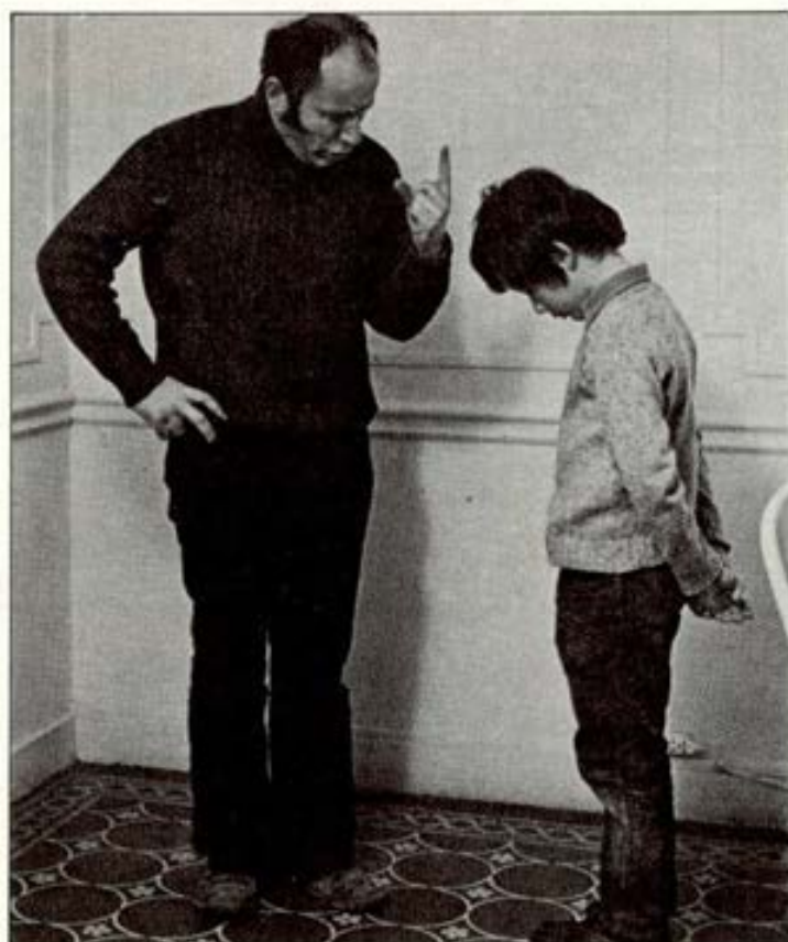
Las rabetas las cojo para molestaros.