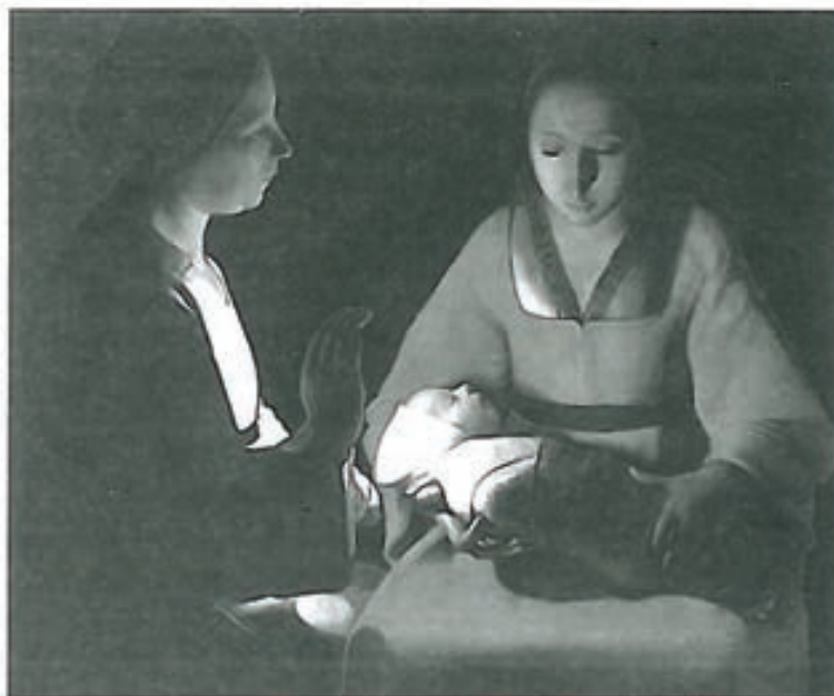
El recién nacido, Georges de La Tour

Este momento previo de gestación es tan importante e imprescindible que, sin él, no hay nacimiento. Es el momento de cuidar eso que está tomando forma en lo oculto, de protegerlo; de acariciar, mimar...; de "dar tiempo al tiempo".