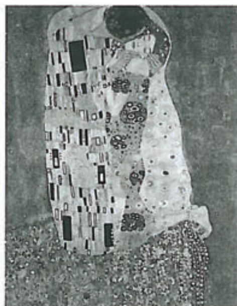
El beso, Klimt