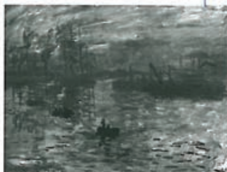
Impresión: amanecer, Monet

Quiero nacer, renacer, - ser lo que no he sido. Naciendo estoy yo, no otro, - Un yo más yo, más humano, más creador, más auténtico, - más sin remedo ni plagio.