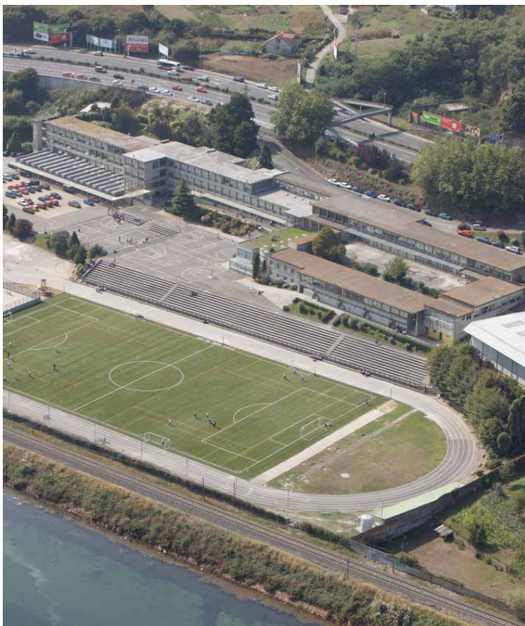
Vista aérea del colegio Santa María del Mar