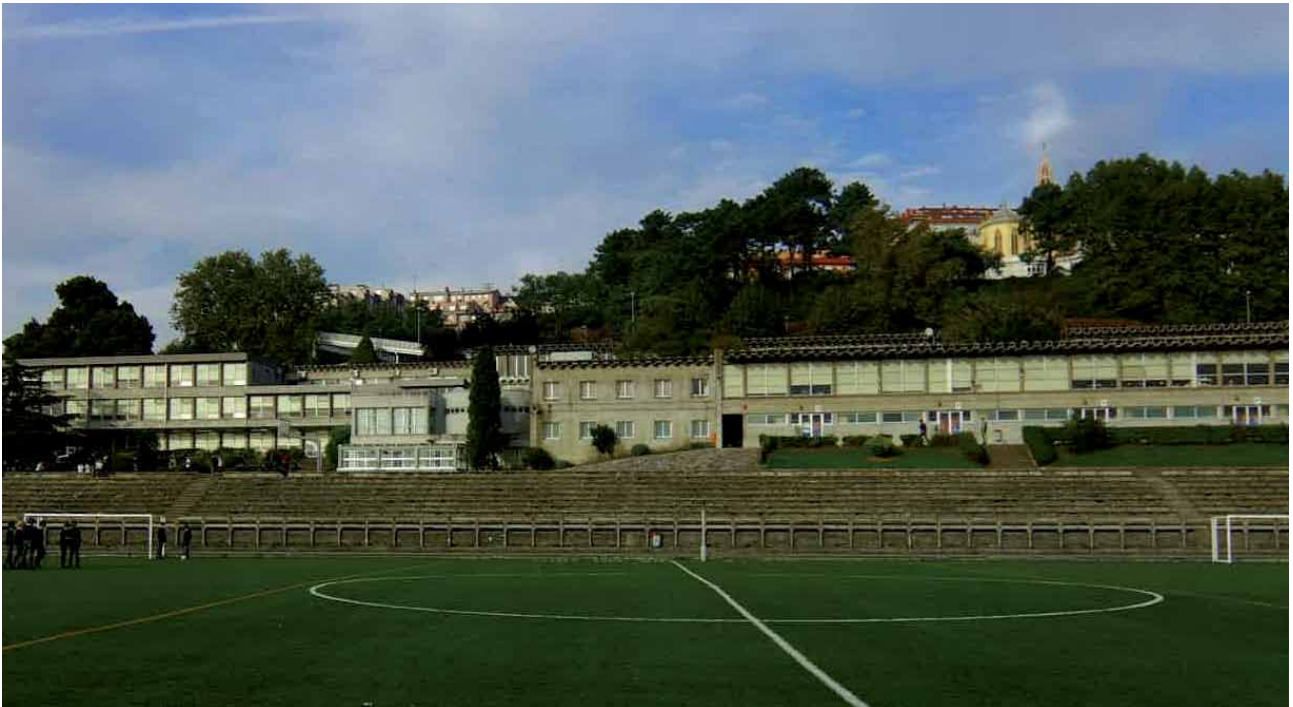
▲ Colegio Santa María del Mar