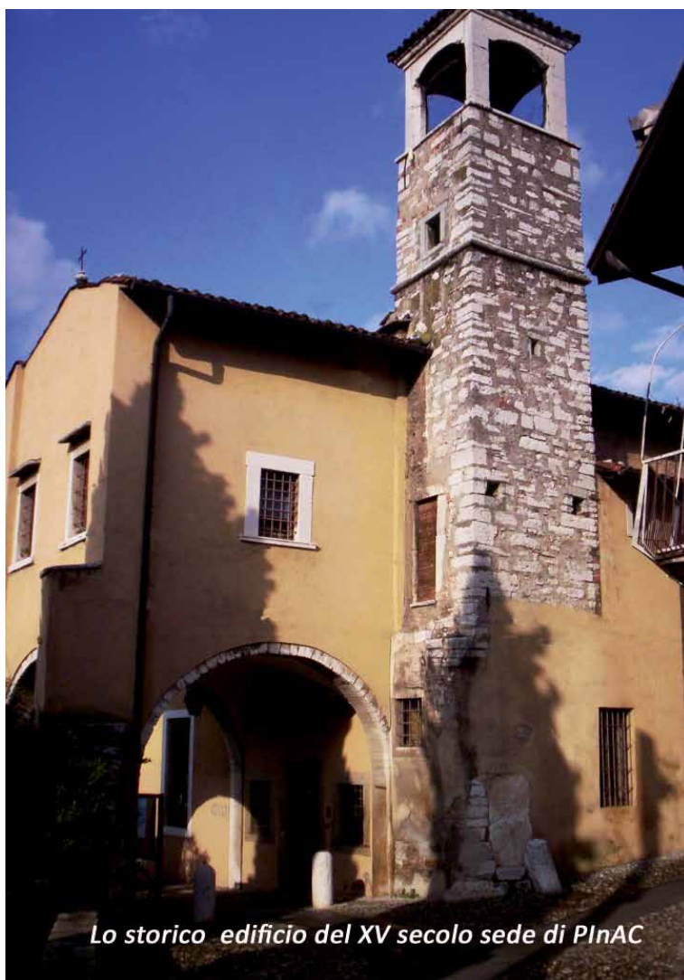
Lo storico edificio del XV secolo sede di PInAC

Pasad, por favor, la puerta está abierta y me gustaría acompañaros.