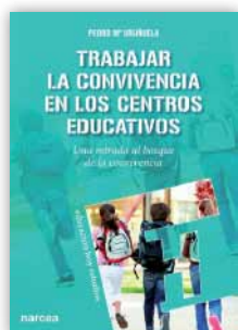
Narcea, 2016 Madrid, 244 páginas

¿Quieres que tu hijo llegue a ser un niño autónomo y con iniciativa, que sepa tolerar la frustración y los errores y tenga capacidad para resolver problemas?, ¿quieres que sea capaz de negociar y de adaptarse a los cambios?, ¿quieres que pueda enfrentarse a sus miedos, trabajar en equipo, compartir, cuidarse y cuidar del otro?, ¿quieres que controle sus emociones y que sea asertivo, tolerante, flexible, comunicativo, empático y reflexivo? Este libro te mostrará con ejemplos y casos prácticos cómo ayudar a tu hijo a conseguirlo, desde el nacimiento hasta los dieciocho años. Con un enfoque innovador y de manera práctica, la autora nos va indicando lo que podemos hacer para desarrollar con nuestros hijos veinte competencias imprescindibles que les ayudarán a vivir en familia y en sociedad. En el libro también se incluye un sistema que permite hacer una valoración del nivel conseguido por nuestro hijo o hija en cada una de las competencias. Hemos de anotar cuál es la situación antes de aplicar los pasos que se exponen para su desarrollo, y lo mismo haremos después de ir aplicando cada paso. Con ello conseguiremos tener información objetiva sobre los logros de nuestros hijos. Con este libro, los padres podemos convertirnos en el entrenador de nuestros hijos. Como un verdadero coach ayudaremos a los niños a desarrollar todo su potencial.