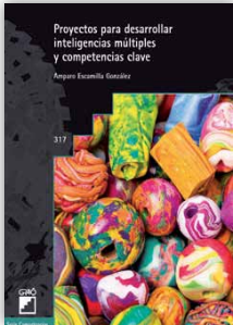
GRAÓ, 2015 Barcelona, 212 páginas