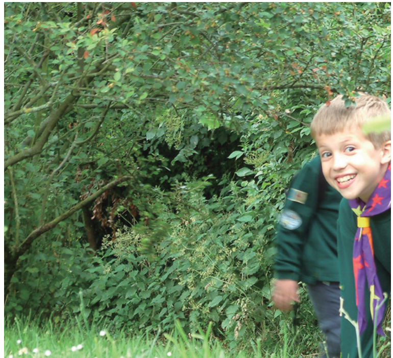
En un mayor contacto con el ciclo de la vida

Todo educador scout es consciente que no transmite únicamente con lo que dice o hace, sino también con lo que es. Entiende que acompañar el crecimiento de la dimensión espiritual, como cualquiera de las demás, no es para él una opción,