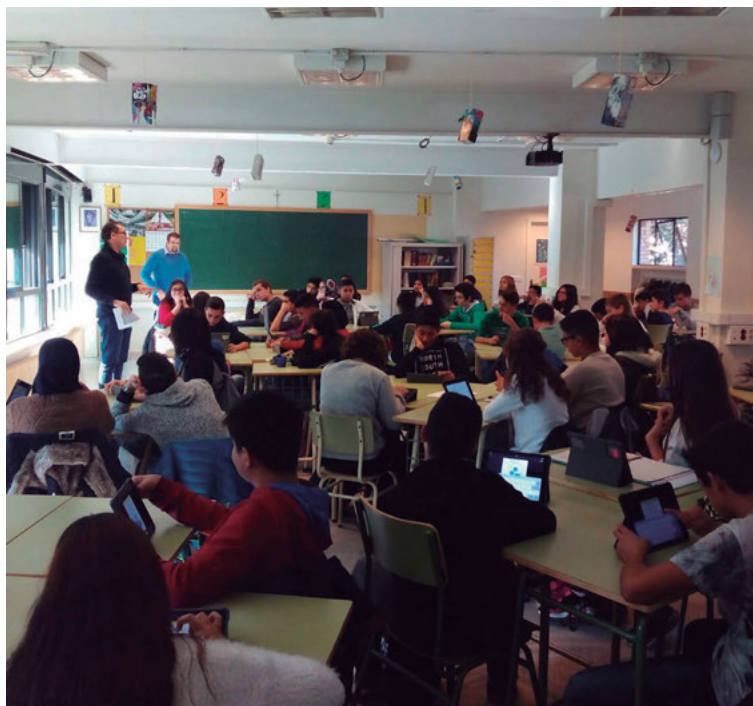
Formación de mediadores escolares, en un aula cooperativa con iPad, de 3º ESO del centro escolar Padre Piquer de Madrid

La mediación es una metodología que organiza el futuro a partir de los recursos del presente teniendo en cuenta el aprendizaje del pasado. A los adolescentes se lo explico en la formación diciendo que es como el agua, que refresca y te da energía, te acoge y acepta con todo lo que tú