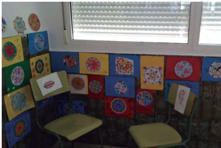
Rincón del diálogo

Comprender las emociones propias y las del otro y adquirir las habilidades para comunicarlas, ayuda a crecer en autorregulación, promoviendo interacciones más positivas. Tomar conciencia de la construcción del propio estilo comunicativo como proceso de aprendizaje puede alimentar la motivación para participar en él activamente, abriéndose a la adquisición de habilidades comunicativas que aporten mejora. Del mismo modo, ser conscientes de los problemas de convivencia del propio grupo-clase, motivará la apertura hacia la adquisición de conocimientos que aporten comprensión de los conflictos y su gestión desde una perspectiva positiva de los mismos.