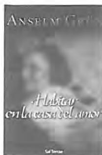
GRÜN, Anselm Habitar en la casa del amor Santander 2005, Sal Terrae, 133 págs.