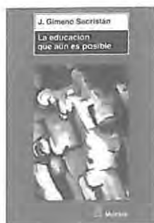
GIMENO SACRISTÁN, J., La educación que aún es posible Madrid, 2005, Morata, 183 págs.

Con el subtítulo de «Ensayos acerca de la cultura para la educación», recopila el profesor Gimeno Sacristán toda una serie de escritos muy distintos, publicados ya con anterioridad de forma fragmentaria y destinados a diferentes públicos, como él mismo indica en el primer capítulo. La obra está dividida en tres partes de desigual extensión. En la primera recoge una serie de rasgos culturales con los que se pueda apoyar un modelo formativo: aparecen así temas tales como el significado y la función de la educación, la insistencia en la sociedad de la información o el papel de las humanidades en esta sociedad. En la segunda parte aborda las herramientas con las que la escuela trata de dotar a los alumnos con el fin de que puedan enfrentarse a esta cultura antes descrita. En la tercera trata de plantear la posibilidad de establecer un proyecto educativo que sirva para adquirir una enseñanza relevante desde el punto de vista de los sujetos a educar.