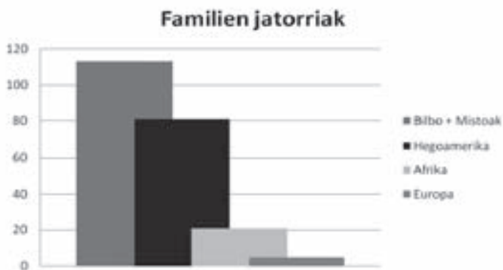
GRAFICO 3 ORIGEN DE LAS FAMILIAS

Datos y Elaboración del Centro Uribarri, 2010.