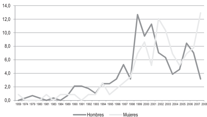
CUADRO 1 CALENDARIO DE LLEGADA DE LOS MIGRANTES MARROQUÍES A CANARIAS SEGÚN SEXO (%)