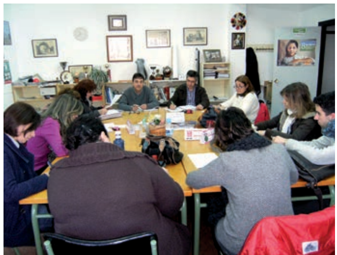
Equipo docente CEIP Antonio Machado de Mérida.

Nuestro centro, gueto social, cultural y económico pone en marcha actuaciones basadas en experiencias de éxito para romper con el círculo de la desigualdad. Proporcionando una educación de calidad, sin dar cabida a la queja y desde planteamientos del proyecto “Comunidades de Aprendizaje”, hemos logrado reducir el absentismo, mejorar los aprendizajes, la convivencia y la participación de familias. Tenemos muchas razones para creer en la transformación.