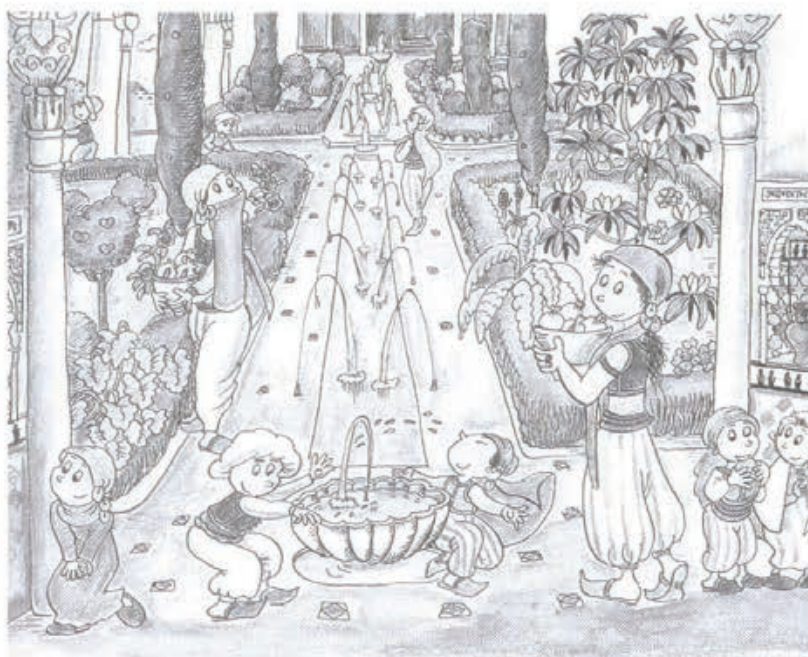
Del libro La Alhambra contada a los niños

Párate delante de una pila de agua, intenta situarte y averiguar dónde está el Este. Cierra los ojos y sumerge tus manos en el agua, mójate la cara, o la frente... ¿Sientes algo especial?