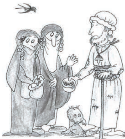
Del libro La Alhambra contada a los niños

"Dale limosna, mujer, que no hay en la vida nada como la pena de ser ciego en Granada".