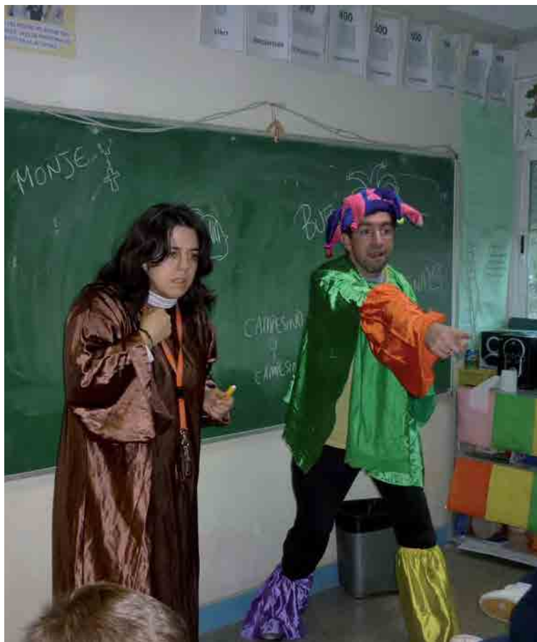
▲ Dos lenguas en el aula.

Para poder abordar toda esta diversidad nuestro centro apostó por una organización docente diferente a la que habitualmente encontramos en otros colegios. En el modelo que pusimos en marcha, inspirado en otros ya existentes (RODRÍGUEZ, 2005; DOMÍNGUEZ Y ALONSO, 2004) incorporamos al tradicional maestro de apoyo o PT dentro del aula, de tal forma, que en todos los cursos contamos con dos tutores. La finalidad de estos dos tutores cubre la doble función de poder atender con calidad a toda la diversidad en sentido amplio que aparece en nuestras aulas y además poder ser fieles al modelo bilingüe que proponemos en nuestro proyecto educativo. Así, contamos con una tutora referente en lengua castellana ("que habla") y otra tutora referente en lengua de signos española (LSE) ("que signa"). Las dos tienen el mismo peso y comparten la misma responsabilidad en todo el proceso de enseñanza-aprendizaje del