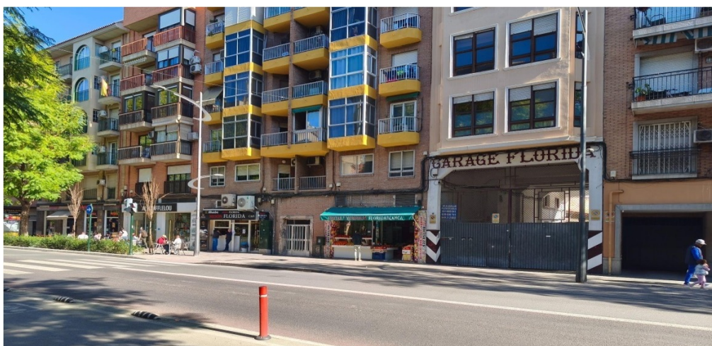
Figura 2. Barrio de El Carmen. Locales comerciales variados y sobre ellos apartamentos residenciales

Desde un punto de vista urbanístico, el distrito de El Carmen presenta un tejido arquitectónico envejecido, caracterizado por edificaciones residenciales de baja altura y una densa red de bajos comerciales (figura 2). Su paisaje urbano, más compacto y heterogéneo que el de otras zonas de la ciudad, configura un espacio de circulación continua, donde los límites entre lo residencial, lo comercial y lo comunitario se diluyen (Giménez-García y García-Marín, 2024). En este marco, fue posible identificar patrones de ocupación del espacio vinculados a adscripciones étnico-culturales: grupos subsaharianos congregados en la plaza principal o frente al casino local; población magrebí concentrada en torno a locutorios y cafeterías; y personas latinoamericanas frecuentando bares y tiendas de alimentación (figura 3). Estas pautas, sin embargo, se desdibujan entre las generaciones más jóvenes, donde se observa una mayor interacción intercultural, la formación de grupos mixtos y una apropiación compartida del espacio urbano que apunta hacia dinámicas de integración más fluidas.