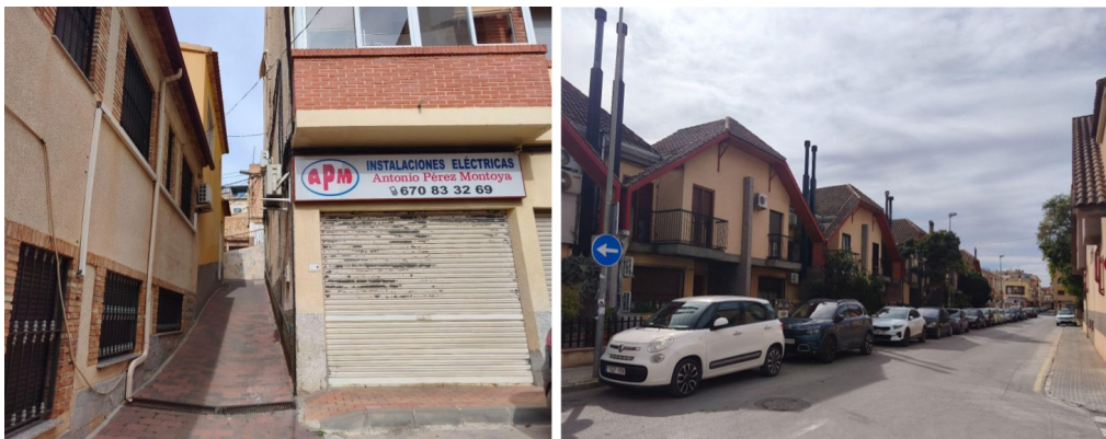
Figuras 4 y 5. Izquierda núcleo central pedanía Cabezo de Torres. Derecha zona de expansión de la pedanía